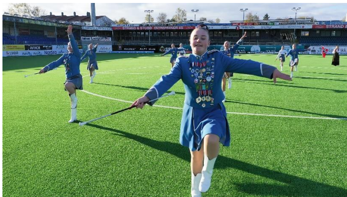
Kristiansund Skolekorps.