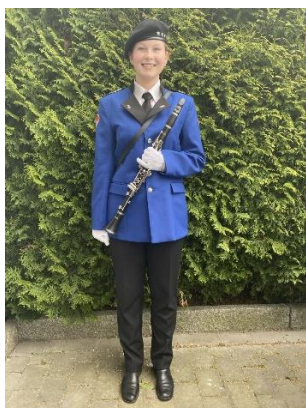
Mari i Skiens skolemusikk.